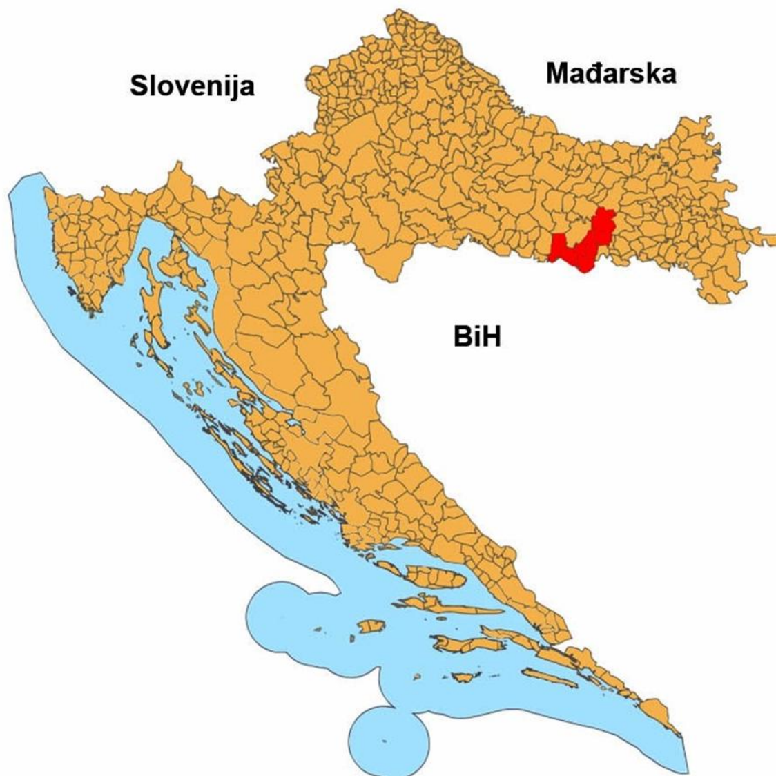
Slika 2: Karta položaja LAG-a na karti Republike Hrvatske